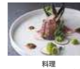
料理 42,350円(消費税込)充当