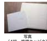
写真 (4切・焼増キャビネ)