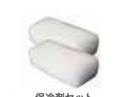
保冷剤セット (1回分10kg)