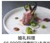
婚礼料理 66,000円(消費税込)を充当