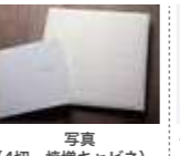
写真 (4切・焼増キャビネ)