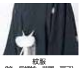
紋服 (袴・長襦袢・草履・扇子)