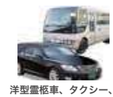
洋型霊柩車、タクシー、 火葬場行きバス