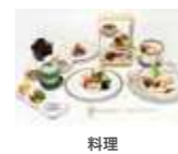
料理 33,000円(消費税込)充当

※使用する互助会金額の消費税は別途必要です。 ※上記役務内容の各項目において上限額を超えた場合は、追加料金が掛かります。 ※消費税相当額を含む総支払額は、24万円コースが264,000円、3万円コースが33,000円、 6万円コースが66,000円、9万円コースが99,000円、12万円コースが132,000円となります。