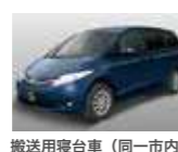
搬送用寝台車 (同一市内)