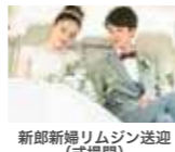
新郎新婦リムジン送迎 (式場間)