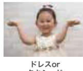
ドレスor タキシード