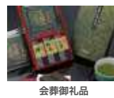
会葬御礼品 (租供用品・引出物 ・香典返し)