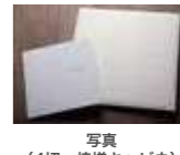
写真 (4切・焼増キャビネ)