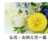
仏花・お供え花一基