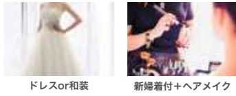
ドレスor和装 新婦着付+ヘアメイク