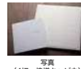
写真 (4切・焼増キャビネ)