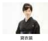
貸衣装 (喪服・モーニング)