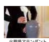
火葬場アテンダント