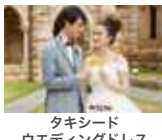
タキシード ウエディングドレス