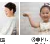
③●ドレスor タキシード