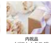
内祝品 (ギフトカタログ) 22,000円(消費税込)分選択