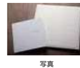
写真 (4切・焼増キャビネ)