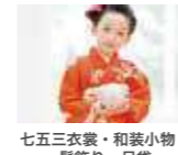
七五三衣裳・和装小物・着付・ヘアセット&メイク 髪飾り・足袋