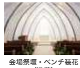
会場祭壇・ベンチ装花 (造花)