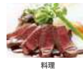
料理 22,000円(消費税込)充当