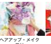
ヘアアップ・メイク 着付