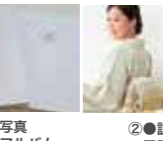
②●訪問着 ヘアアップ 着付・小物