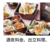
通夜料金、出立料理、 初七日料理