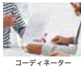
コーディネーター