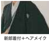
新郎着付+ヘアメイク