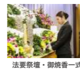
法要祭壇・御焼香一式 ・御寺院様接待