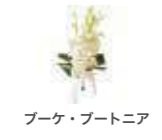
ブーケ・ブートニア

※現地での対応・施行につきましては、KURAUDIA USA.LTD他、互助会の所属スタッフが賜ります。 ※内容について、互助会の都合または式場の都合により用途変更または廃止する場合がありますのでご了承ください。