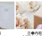
①●写真 シンプルアルバム +データ