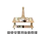
御骨安置用後飾祭壇