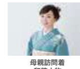
母親訪問着 和装小物