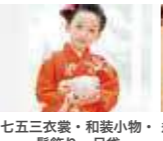
七五三衣裳・和装小物・着付・ヘアセット&メイク 髪飾り・足袋