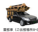
霊柩車 (ご出棺場所から 最寄りの火葬場まで) ※斎場により洋型車に変更となります