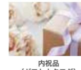
内祝品 (ギフトカタログ) 11,000円(消費税込)分選択