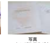
写真 シンプルアルバム +データ