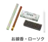
お線香・ローソク