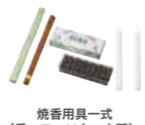
焼香用具一式 (香・ローソク・火桶)