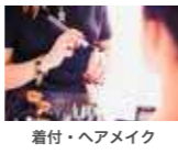
着付・ヘアメイク