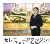
セレモニーアテンダント (通夜・葬儀)