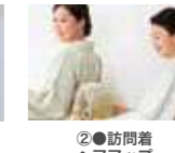
②●訪問着 ヘアアップ 着付・小物