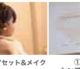
①●写真 シンプルアルバム +データ