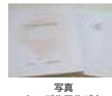
写真 シンプルアルバム +データ