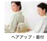
ヘアアップ・着付