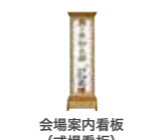
会場案内看板 (式場看板)