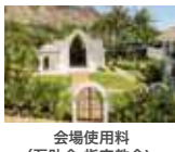
会場使用料 (互助会 指定教会)