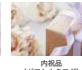
内祝品 (ギフトカタログ) 11,000円(消費税込)分選択