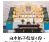
白木格子祭壇4段・ 祭壇両脇・生花装飾1対