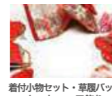
着付小物セット・草履バック セット・ヘア飾り