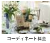
コーディネーター料金