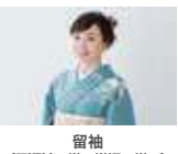
留袖 (長襦袢・帯・帯揚げ)