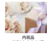
内祝品 (ギフトカタログ) 11,000円(消費税込)分選択