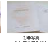
①●写真 シンプルアルバム +データ