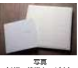
写真 (4切・焼増キャビネ)