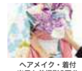
ヘアメイク・着付 当日と前撮り2回分